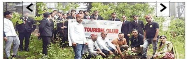
कुफरी : आई.एच.एम. कुफरी द्वारा लाल के पास पौधारोपण करते हुए छात्र व अन्य लोग।